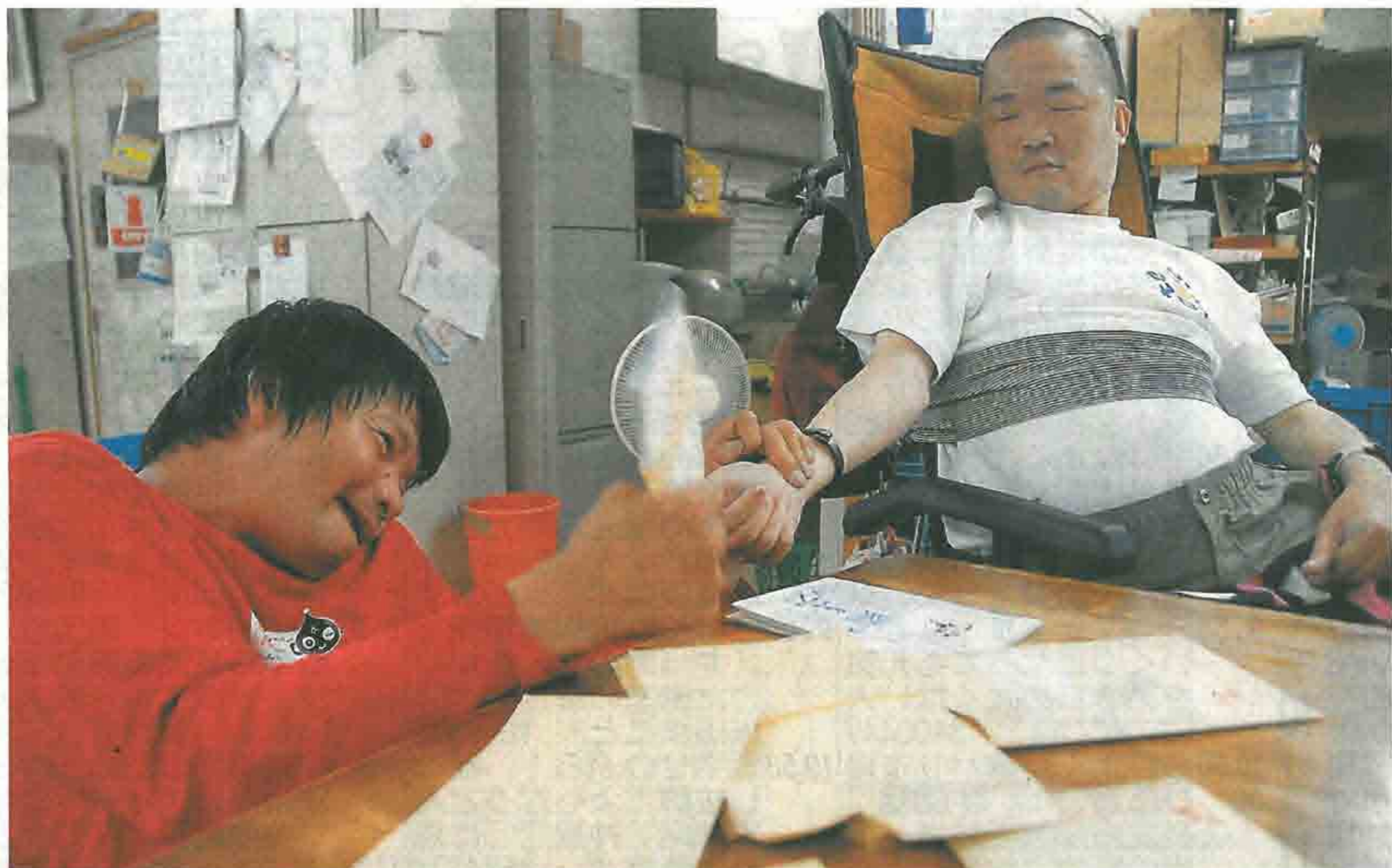
「大阪府箕面市の「豊能障害者労働センター」」

健常者と同じ仕事をするのは難しく、福祉施設で得る月1万円余の賃金ではとても生活できない。そんな重い障害がある人の経済的自立を後押ししてきた大阪府箕面市の独自制度が、国のモデル事業の候補に選ばれた。1人の障害者の訴えから生まれた取り組みが、全国に広がるきっかけになるかもしれない。