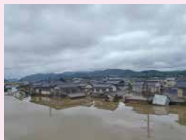
被災地の障害者支援 (岡山県倉敷市真備町) 2018.7.7